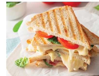
ŚNIADANIE: Tosty z serem; 3 WW i 0,6 WBT