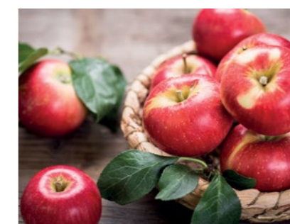
PODWIECZOREK: Owoc 1 WW