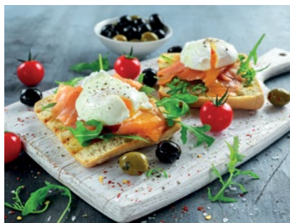
ŚNIADANIE: Kanapka z serkiem białym, łososiem i pomidorem; 3 WW i 2,3 WBT