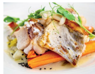
OBIAD: Dorsz duszony z warzywami; 5 WW i 3 WBT